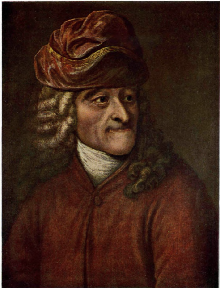
ВОЛЬТЕР Портрет маслом Жана Гюбера Исторический музей, Москва