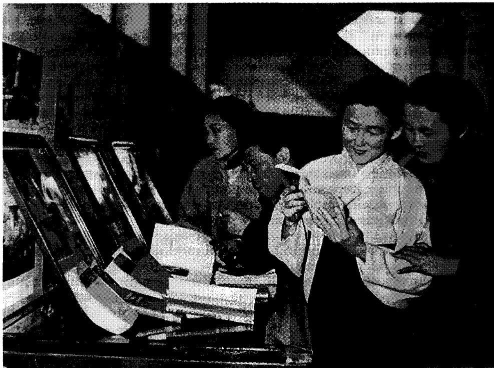
ВЫСТАВКА КНИГ, ПОСВЯЩЕННАЯ СТОЛЕТИЮ СО ДНЯ РОЖДЕНИЯ ЧЕХОВА Пхеньян, 1960 Литературный музей, Москва

Как выдающееся событие в истории мировой культуры широко отмечалось в Корее 100-летие со дня рождения Чехова. Торжественные собрания прошли в Пхеньяне и в других городах страны. В ознаменование юбилея писателя Государственный драматический театр Кореи осуществил постановку пьесы «Дядя Ваня». В связи с этим событием драматург Син Госон в статье «А.П.Чехов — любимый писатель корейского народа» писал: «Постановка Государственным драматическим театром «Дяди Вани» позволила нашему зрителю еще глубже проникнуть в чеховский мир. Чехов, который не только сумел так ярко отобразить мрачную действительность старой России, но и создал полнозвучную музыку стремления к жизни и любви, еще больше покорила публику.