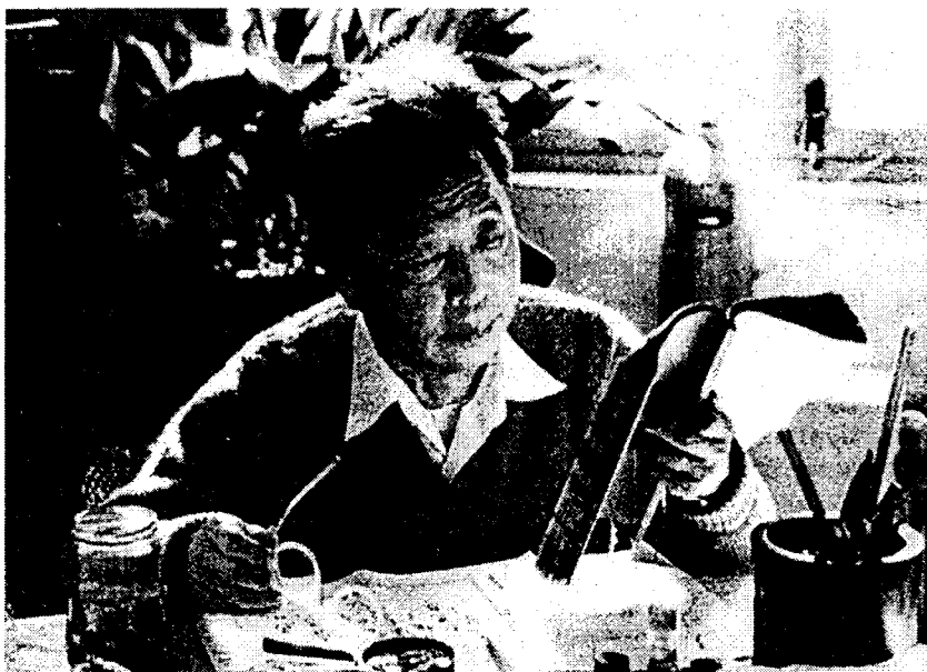
ЦАО ЮЙ (1910–1996)