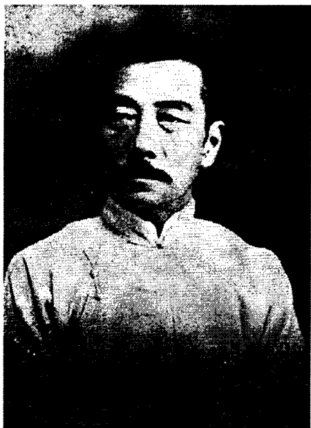
ЛУ СИНЬ (1881–1936) Шанхай, 1930 Фотография

Лу Синь же, утверждая, что “отсталая идеология и пассивность крестьян <...> мешают им пробудиться”, размышлял и о том, “какая идеология и какое душевное состояние должны быть у крестьян” 12 в случае новой революции; и тем самым сочетал тему крестьянства с темой революции.