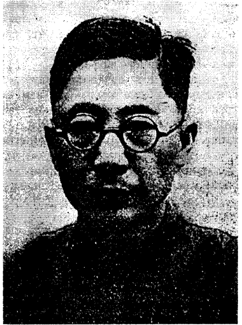
ЛАО ШЭ (1899–1966)

Пьесы Лао Шэ (1899–1966), знаменитого беллетриста и драматурга, испытывавшего на себе главным образом влияние западноевропейской литературы, во многом отличны от пьес Чехова. Но его пьеса “Чайная” часто воспринимается как написанная под чеховским влиянием. Ван Пу в вышеуказанной статье «Чехов и “тенденция дедраматизации” китайской драмы» полагал, что “Чайная” похожа на пьесы Чехова тем, что в ней есть мелочи обыденной жизни, родственные действующие лица, диалоги, не имеющие связи между