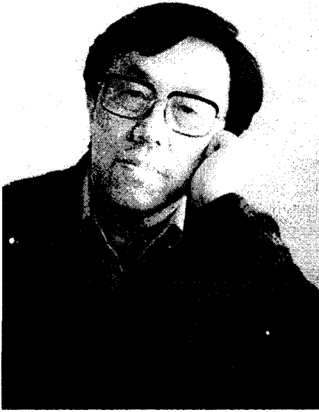
ВАН МЭН (р. 1934)