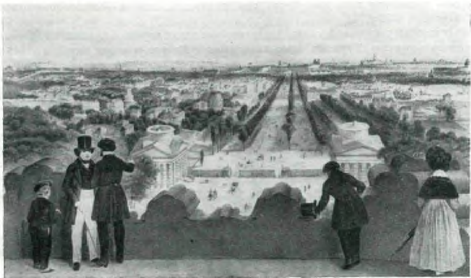
ПАРИЖ. ОБЩИЙ ВИД Цветная литография Ф. Бенуа

Из альбома «Promenade dans Paris et ses environs par J. Jacottet et Ph. Benoist». Paris, s. a.