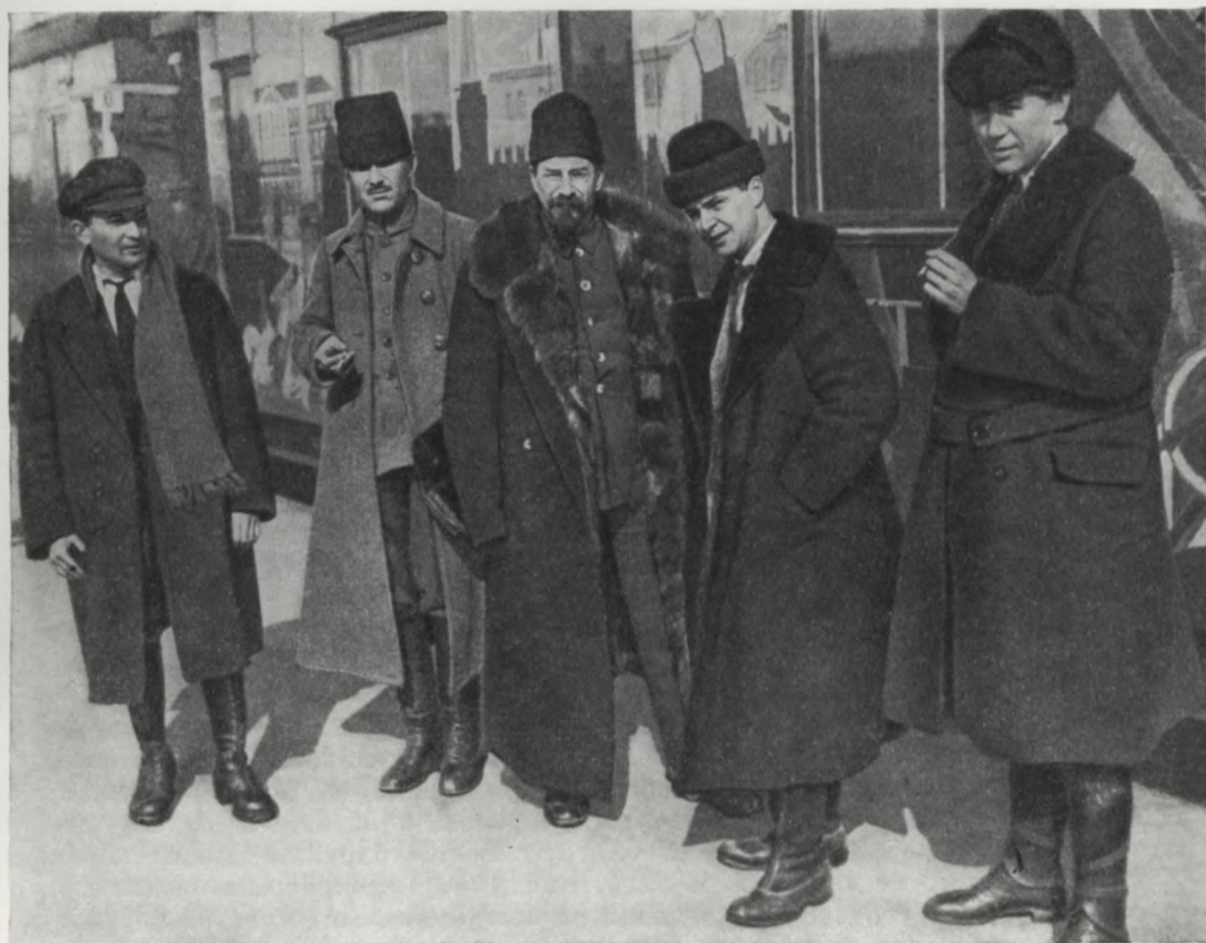
ЛУНАЧАРСКИЙ В ТАМБОВЕ