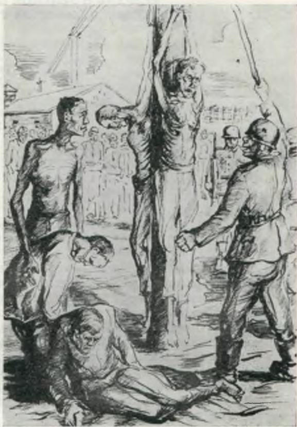
Рисунок А. И. Пахомова (тушь). Лагерь Цейтхайн, 1942—1943 гг. Музей Революции СССР, Москва