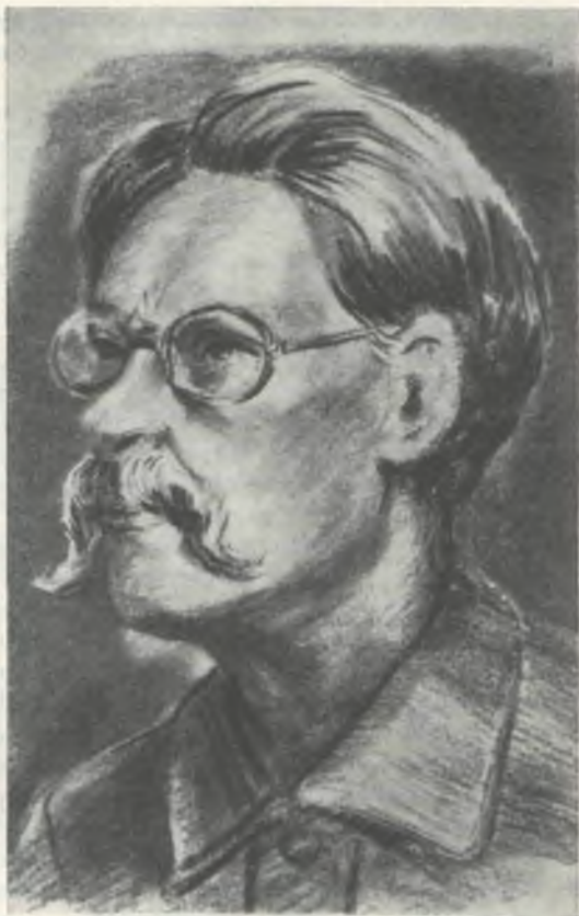
Рисунок А. И. Пахомова (угольный карандаш). Осень 1942 г. Собрание А. И. Пахомова, Сочи

лагерных подпольных тайниках специальной комиссией по расследованию фашистских зверств в лагере 304-Н и затем вывезены из Германии. Но архивы оккупационных органов Советской Армии еще до конца не разобраны, и эти бумаги где-то лежат среди «дел», находящихся, как говорят архивисты, «в тюковом состоянии».