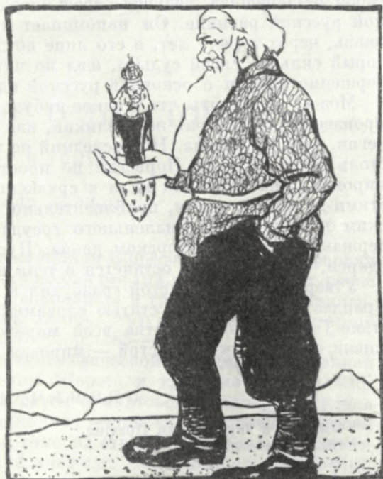
Tolstoj och tsaren.

(Från den schweiziska skämttidningen «Nebelspalter».)